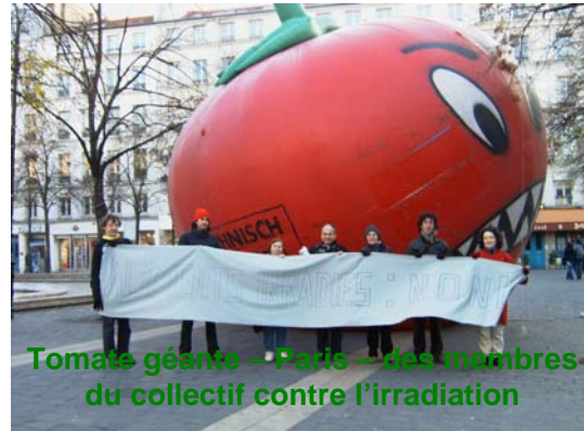
Tomate géante – Paris – des membres du collectif contre l'irradiation

Après l'appel La semaine internationale d'actions lancée en mars partout en France se 2005 pour demander l'interdiction de l'irradiation des aliments par un collectif d'associations, le mdrgf a répondu présent lors de