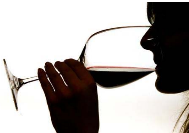
Insgesamt wurden für die Studie 40 Rotweine untersucht. Nur die Bio-Weine waren größtenteils frei von Pestiziden

Weine aus Deutschland und anderen europäischen Ländern sind einer Untersuchung zufolge häufig mit Pflanzenschutzmitteln belastet. Bei einer Analyse von 40 Weinsorten seien in 35 Pestizidrückstände festgestellt worden, heißt es in der in Brüssel vorgestellten Studie des Aktionsnetzwerks gegen Pestizide.